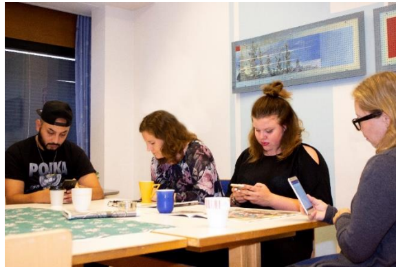
Kuva: Venla Parviainen